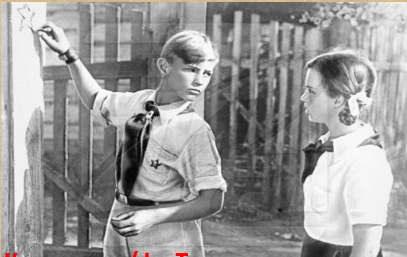
Кадры из х/ф «Тимур и его команда»