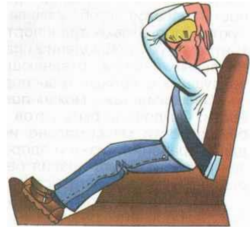
Безопасная поза при возможном столкновении автомобиля

Сильно напрягите все тело (мышцы), втяните голову в плечи. Расслабляться нельзя до полной остановки автомобиля.