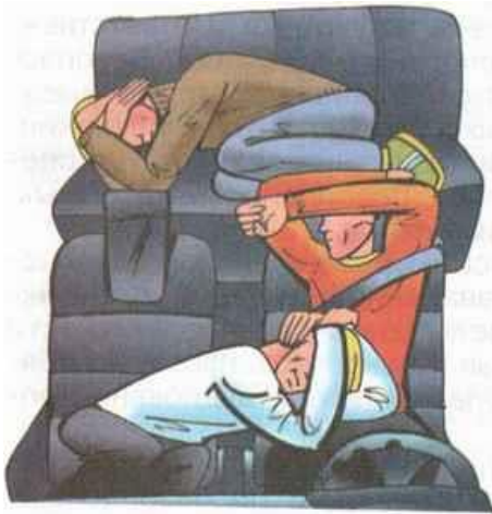
Позы водителя и пассажиров при неизбежности столкновения